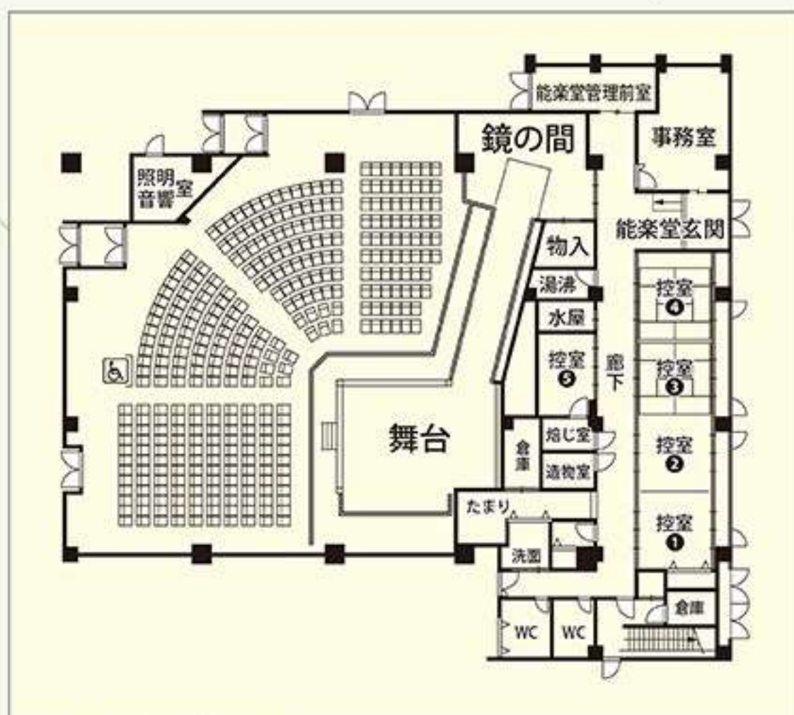
〈能楽堂及び能楽控室見取図〉

12.車でお越しの場合は、参道（県道三輪山線）沿いの神社参拝者 無料駐車場を利用頂くようご案内下さい。但し、出演等関係者 用として会館南側に2～3台分の駐車場があります。