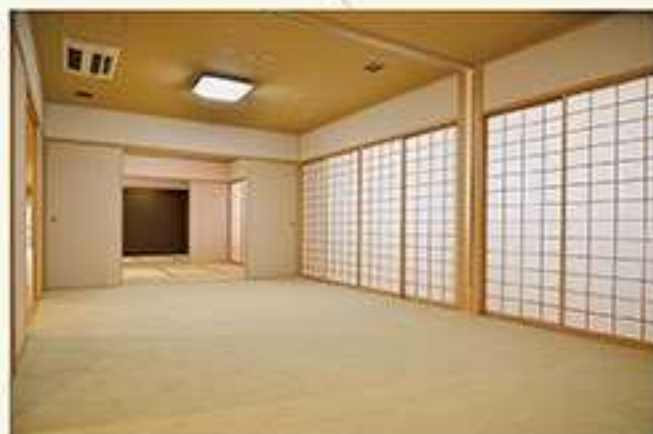
能楽堂 控室 (楽屋)