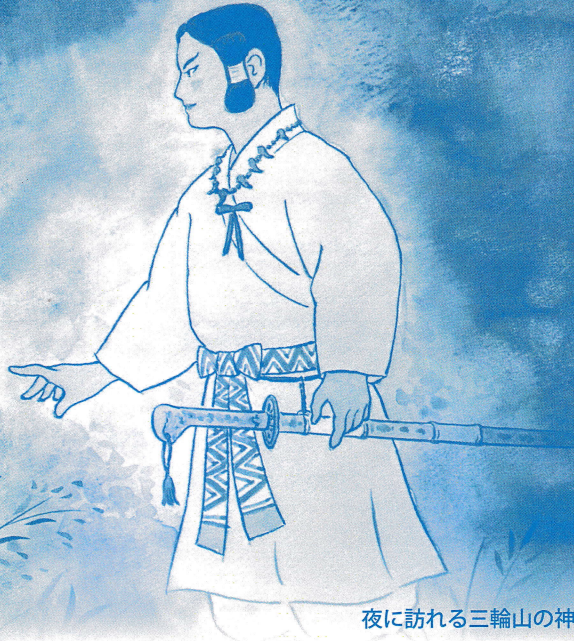
夜に訪れる三輪山の神